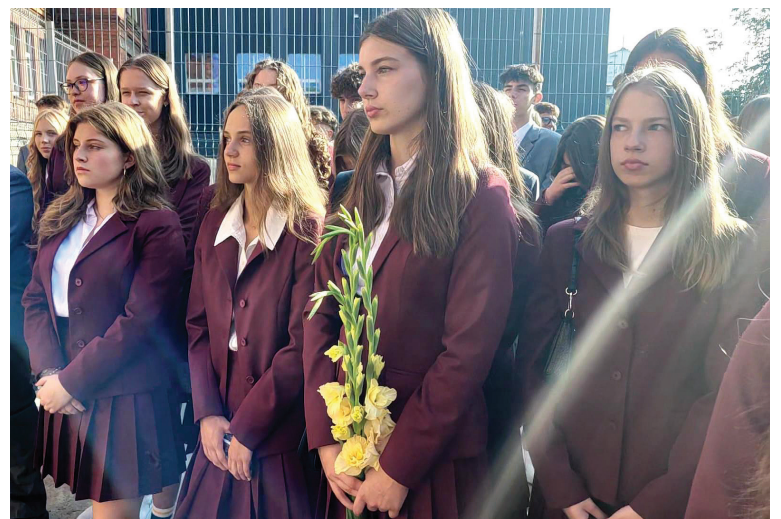
Pirmokai Rugsėjo 1-osios šventėje.