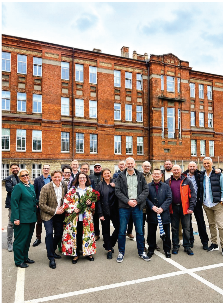
1996 m. laidos 4A klasės alumnai gimnazijos kieme.

Nors šiandien buvę klasės draugai yra žinomi visuomenininkai, vadovai, gydytojai ir kitų įvairių sričių specialistai, susitikimo metu jie išliko tokie pat nuoširdūs, šilti ir nestokojantys humoro jausmo. Pokalbiai liejosi vienas po kito, nes senos draugystės ir bendri prisiminimai vėl suvienijo klasės draugus, tarsi tie trisdešimt metų būtų prabėgę akimirksniu.