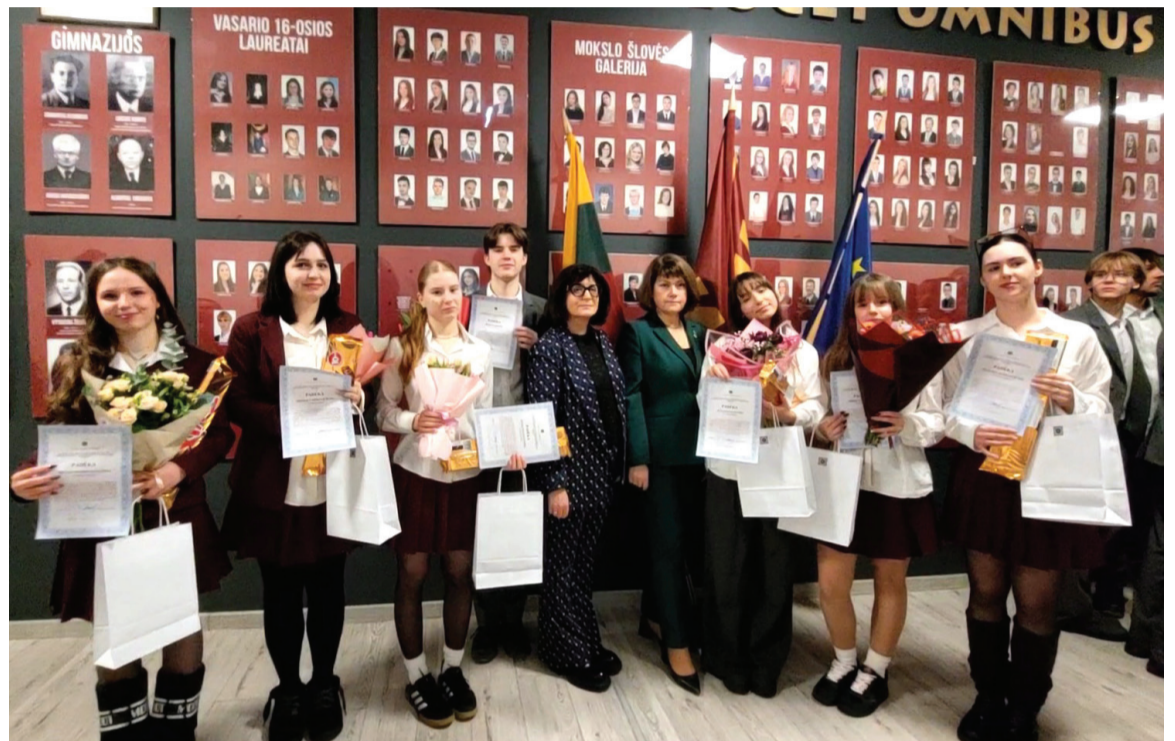
Vasario 16-osios laureatai – gimnazijos mokinių tarybos komitetų koordinatorių komanda.