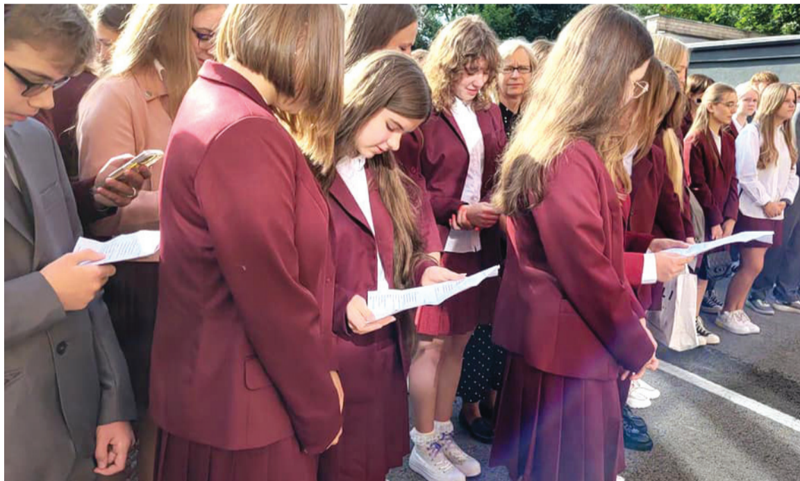
Pirmokai taria priesaikos žodžius.

Galiausiai džiaugsmingai noriu perduoti pirmokų linkėjimus pedagogams bei mokiniams.